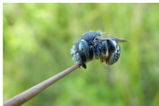
Mannetje kleine wolbij slapend aan een halm

www.Waarneming.nl , Stichting Observation International en lokale partners".